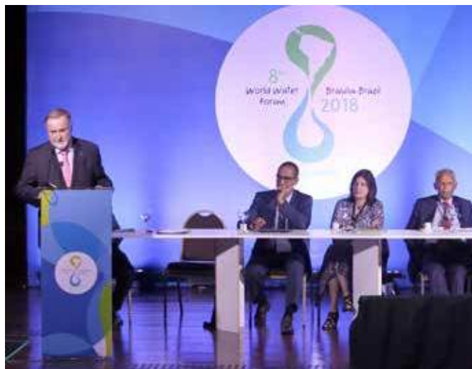
Почетный президент Всемирного водного совета Лоик Фошон выступает на заседании Группы высокого уровня по производству, воде и устойчивому развитию, 20 марта

В ходе ряда мероприятий 8-го Всемирного водного форума и, в особенности, во время Дня бизнеса была отмечена необходимость в вовлечении и сотрудничестве с частным сектором. На мероприятии собрались специалисты и представители производства для принятия Бразильского обязательства бизнес кругов по отношению к водной безопасности, демонстрируя экологическую ответственность предприятий. Создание конструктивных связей и поддержание доверия между частным сектором, гражданским обществом и правительством было выделено в качестве направления дальнейших действий во время Дня бизнеса. Эти послания вновь звучали в ходе других мероприятий, а именно на заседании Группы высокого уровня по производству, воде и устойчивому развитию, участниками которого были руководители и представители крупных мировых корпораций, например, «Электрисите де Франс», «Юнилевер» и «Нестле».