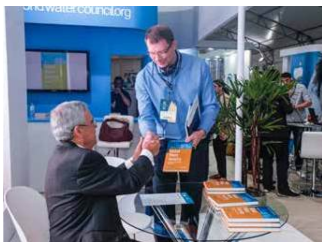
Президент Всемирного водного совета Бенедито Брага на автограф-сессии книги «Глобальная водная безопасность», 19 марта

Демонстрируя многообразие вопросов, оказывающих отрицательное воздействие на страны в разных регионах, данная публикация отражает территориальную, временную и культурную динамику водной безопасности.