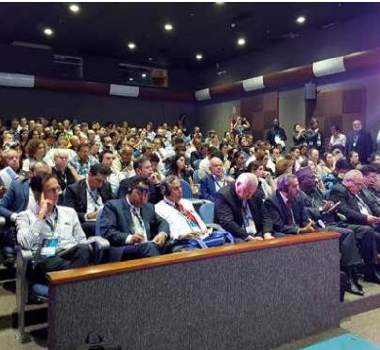
Участники сессии высокого уровня по повышению финансовых потоков в санитарную и утилизацию отходов, 20 марта

Во время 8-го Всемирного водного форума были организованы очередные и специальные сессии, такие, как «Санитарные услуги в небольших городках», «Подход, предусматривающий полный охват населения санитарными услугами, санитарная цепочка и инновации», а также сессия по «Решению проблемы недостаточной обеспеченности санитарными услугами» в попытке привлечь больше внимания к вопросам санитарии. Они также обсуждались на сессии Группы высокого уровня по повышению финансовых потоков в санитарную и утилизацию отходов.