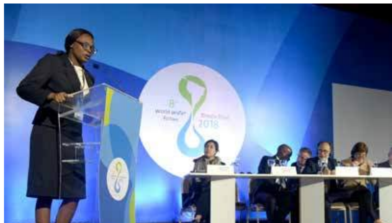
Эксперты принимают участие в первом Международном учебном судебном процессе по воде, впервые прошедшем на 8-м Всемирном водном форуме 21 марта

Впервые в истории Всемирных водных форумов в Бразилии было предусмотрено участие судей и прокуроров – высших органов по вынесению судебных решений по воде. Помимо Декларации прокуратуры о праве на воду на португальском языке, в результате обсуждений в ходе различных сессий была подготовлена Декларация судей о правосудии в области водных ресурсов, включающая 10 принципов. В Декларации отмечается истинная роль судей в достижении правосудия в области воды с перечислением различных средств, находящихся в их распоряжении, и как их решения влияют на разные социальные группы.