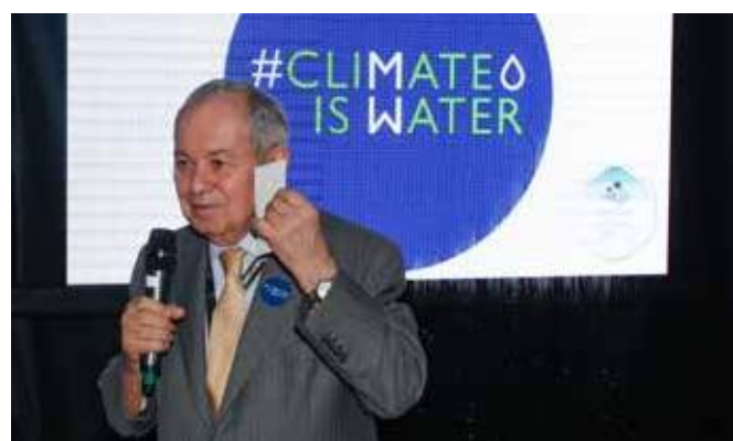
Вице-президент Всемирного водного совета Доган Алтинбилек на специальном вечернем приеме у выставочного стенда Совета, 21 марта

Достичь национальных целей по адаптации к изменению климата и смягчению его последствий невозможно без учета воды в национальном, региональном и международном планировании. Поэтому заинтересованные стороны приглашаются к работе в направлении продвижения воды в качестве сильного компонента таких механизмов как Определяемые на национальном уровне вклады (NDC) и Национальные планы адаптации (NAP). В виде долгосрочной цели ожидается, что водные вопросы будут включены и затронуты на всех политических и технических уровнях.