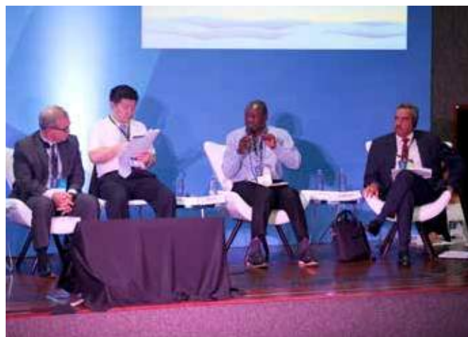
Участники сессии высокого уровня по повышению финансовых потоков в санитарную и утилизацию отходов во время обсуждения, 20 марта

Предложенные концепции ориентируются на улучшение работы, эффективности и руководства. Более сильная нормативно-правовая база привлечет финансы в сектор санитарии от большего числа инвесторов. Это также повысит инвестиционную привлекательность проектов и поможет привлечь больше внимания к проектам. В ходе обсуждения несколькими членами группы была озвучена идея социальных сдвигов в восприятии и поведении.