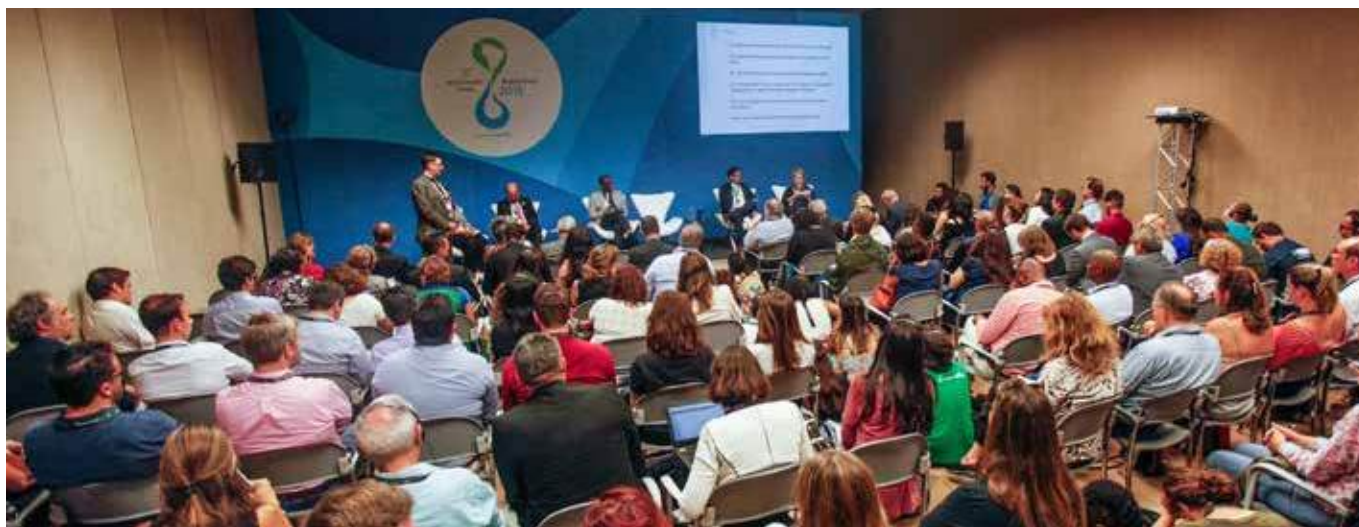
Сессия высокого уровня «Увязка водных проблем и изменения климата» прошла с аншлагом, 19 марта

Климат был одной из девяти основных тем 8-го Всемирного водного форума. Вдобавок, на сессии высокого уровня по климату было подчеркнуто, что «вода является общим знаменателем, как для проблем, так и решений по созданию устойчивых систем».