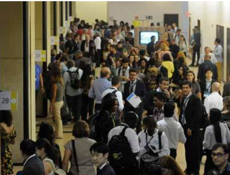
Коридоры конференц-центра «Одиссей», переполненные участниками различных сессий

В качестве одного из ключевых процессов Всемирного водного форума, Тематический процесс рассматривал шесть главных тем – климат, население, развитие, города, экосистемы и финансы – и три междисциплинарные темы – совместное использование, потенциал и руководство. В рамках этих девяти тем и вопросов было выделено 32 подтемы, охваченные на 95 сессиях, которые координировались 430 организациями в целом.