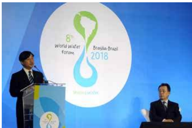
Наследный принц Японии Нарухито зачитывает приветственную речь на сессии высокого уровня «Повышение подготовленности к рискам стихийных бедствий», 19 марта

Политические лидеры высокого уровня собрались на 8-м Всемирном водном форуме, чтобы повысить информированность, обсудить совершенствования в области науки и техники и активизировать мобилизацию достаточных финансовых средств для решения проблемы связанных с водой стихийных бедствий и их последствий. В числе политических лидеров присутствовали Президент Венгрии, Наследный принц Японии и Министр природных ресурсов и охраны окружающей среды Мьянмы.