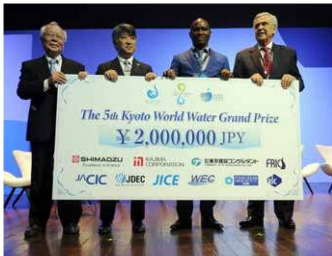
Победители 5-го Киотского главного водного приза «Charité Chrétienne pour Personnes en Détresse» получают свою награду от Президента Всемирного водного совета Бенедито Брага, 23 марта