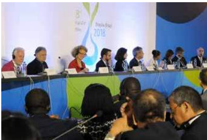
Конференция парламентариев, 20 марта

В Декларации парламентариев, подготовленной по итогам Конференции, вновь подчеркнута значимость воды в превращении ЦУР из видения в осязаемые результаты. В ней отмечена потребность в многостороннем сотрудничестве и партнерстве на национальном и глобальном уровне и подчеркнута важность демократических процессов с участием всех заинтересованных сторон для достижения эффективного управления водными ресурсами.