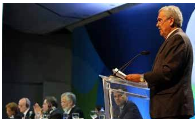
Президент Всемирного водного совета Бенедито Брага выступает перед министрами со всего мира на церемонии открытия Конференции министров, 19 марта.

В Декларации также отмечается важность партнерств, созданных во время 8-го Форума, для обеспечения реализации мер, указанных этом документе. С целью обеспечения преемственности и плавного перехода, в Декларации подчеркивается значение вклада в Политический форум высокого уровня по устойчивому развитию. В этой связи предлагается, чтобы Политический форум учел в своем обзоре Целей устойчивого развития, включая ЦУР 6, результаты политического, тематического, регионального, гражданского процессов, а также процесса устойчивости 8-го Всемирного водного форума.