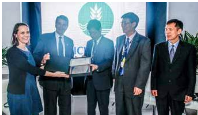
Победители Программы всемирного водного наследия принимают награду, 19 марта