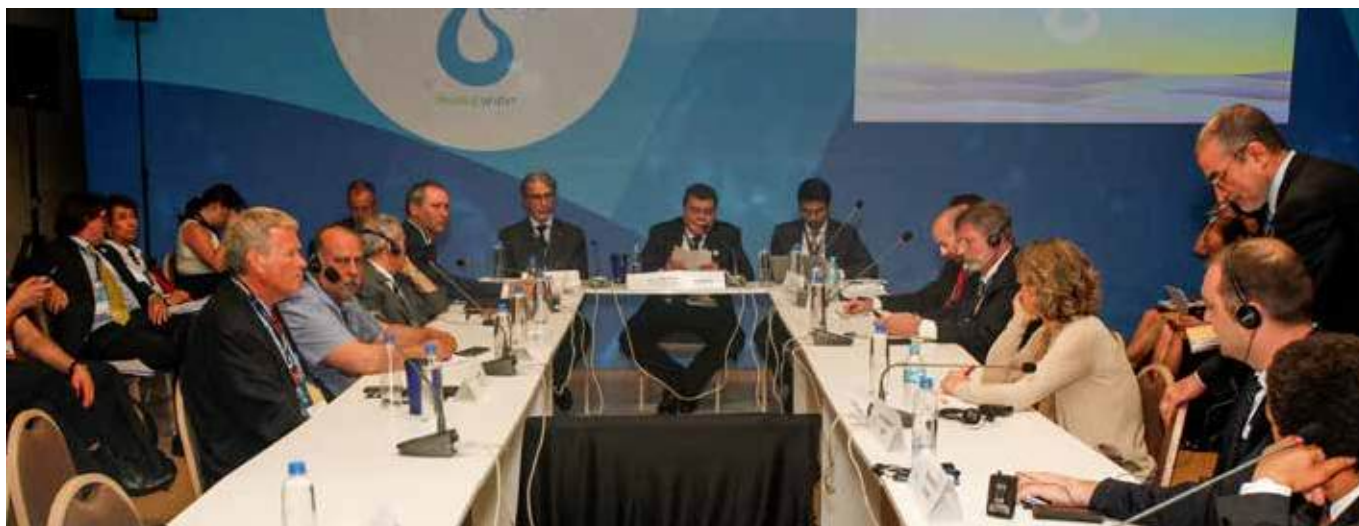
Участники круглого стола по климату на министерском уровне, модератор – Министр окружающей среды Бразилии Жозе Сарни Фило.

Министерская декларация под заголовком «Срочный призыв к решительным действиям по воде» явилась результатом обсуждения, проходившего на протяжении нескольких месяцев в преддверии 8-го Всемирного водного форума. Призывая все страны к срочным действиям по решению проблем водоснабжения и санитарии, Декларация определяет области, требующие конструктивных изменений, а именно: