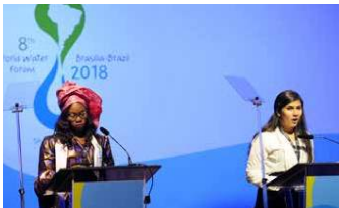
Представители молодежи зачитывают Декларацию об устойчивости на церемонии закрытия Форума, 23 марта.

В качестве нового продукта Всемирного водного форума Декларация об устойчивости, зачитанная на церемонии закрытия 8-го Форума, призвала к срочной мобилизации всех сторон, чтобы обеспечить будущее в гармонии с окружающей средой. Для этого Декларация рекомендует, чтобы ООН, правительства и общество рассматривали воду в качестве ключевого элемента в достижении устойчивости. Также сделано обращение к Политическому форуму высокого уровня ООН по устойчивому развитию с просьбой оказать содействие в создании кооперативных альянсов, воздухохозяйственных реформах и финансовых инновациях.