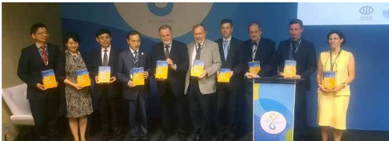
Участники специальной сессии по водной безопасности и ЦУР и Почетный президент Всемирного водного совета Лоик Фошон (пятый слева) на презентации книги «Глобальная водная безопасность», 19 марта

Тема водной безопасности широко обсуждалась во время Форума в разных форматах, но особое внимание она получила на специальной сессии «Водная безопасность и ЦУР», где обсуждались различные перспективы, вызовы и альтернативы вокруг водной безопасности.