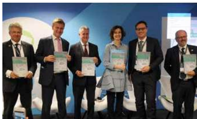
Презентация Доклада ООН о состоянии водных ресурсов мира, 19 марта

будет проводиться в районе 22 марта в Дакаре. Празднования Дня воды в рамках Форума проходили в разных форматах, в т.ч. был организован вечерний прием, на котором были озвучены мероприятия, организованные по всему миру в этот день.