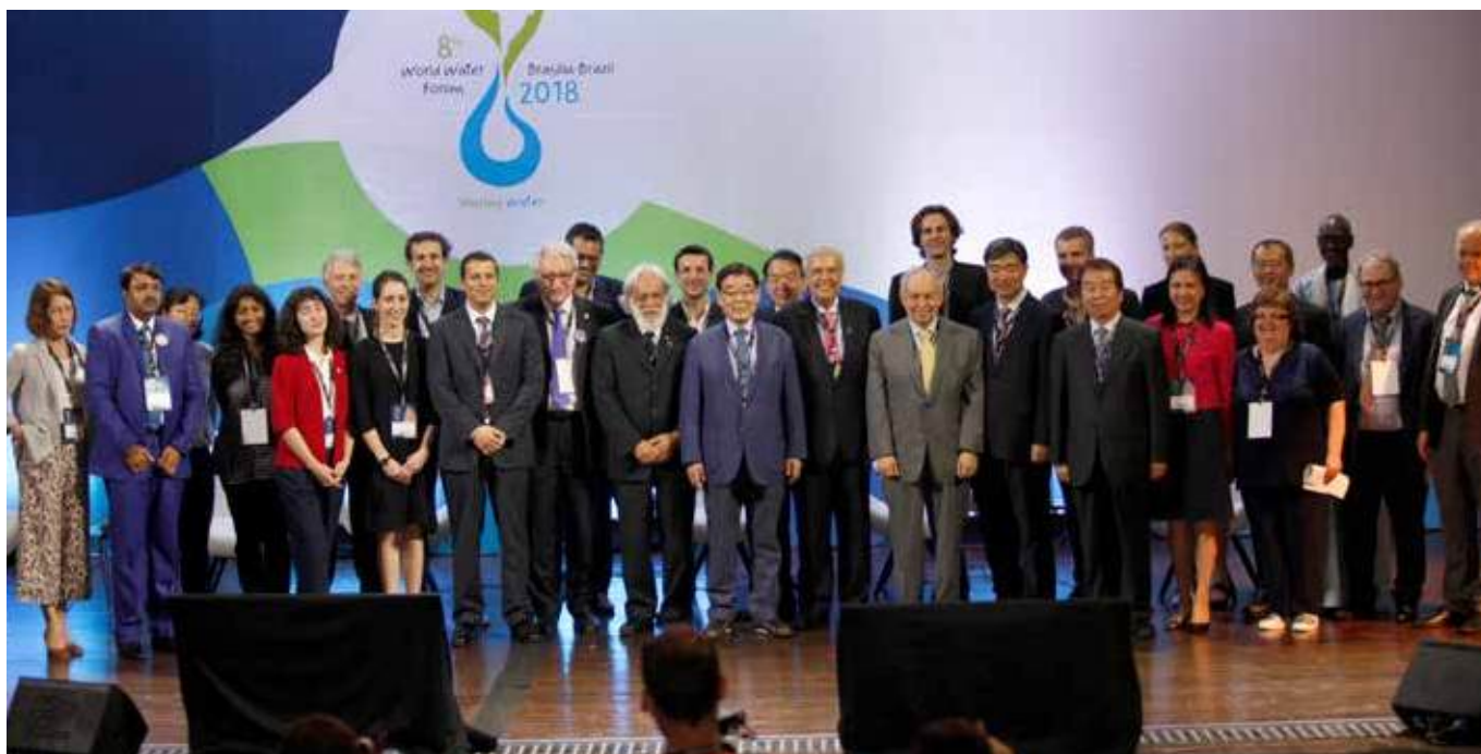
Лидеры ОБРТК и члены ключевых групп на 8-м Всемирном водном форуме спустя три года после принятия «Дорожных карт» мероприятий, 21 марта

На специальной сессии, организованной Всемирным водным советом в сотрудничестве с Министерством земельных ресурсов, инфраструктуры и транспорта Южной Кореи и Корейским водным форумом (КВФ), были представлены достижения за три года лидеров в области Обязательств по выполнению решений, принятых в Тэгу-Кенгбук, и их ключевых групп. «Дорожные карты» мероприятий (ДКМ) как добровольный механизм мониторинга прогресса по решению различных проблем, связанных с водой, должны были послужить катализатором долгосрочных коллективных действий по воде, исходя из целей, определенных на 7-м Всемирном водном форуме. На сессии был представлен сводный отчет по ДКМ, который включал как количественный, так и качественный анализ прогресса, достигнутого по каждой из 16 ДКМ. По оценкам, 61% целей были достигнуты с момента 7-го Форума, а 36% все еще находятся в процессе выполнения, причем степень их достижения составляет 97%. Кроме того, было сформулировано 14 рекомендаций, чтобы перейти к оценке Политическим форумом высокого уровня ЦУР 6.