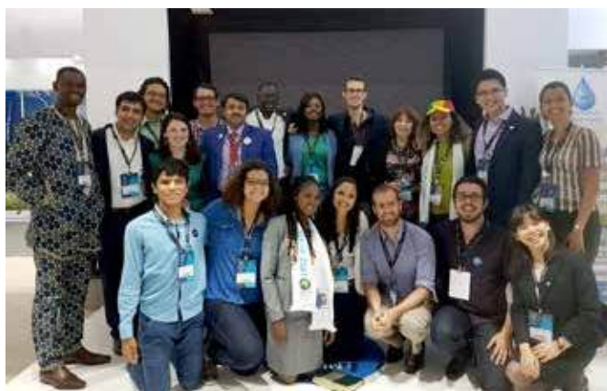
Представители молодежи на 8-м Всемирном водном форуме для привлечения внимания к роли молодежи в водных вопросах, 22 марта

Тематический процесс требовал сбалансированного участия различных заинтересованных сторон на сессиях 8-го Всемирного водного форума. В итоге процент участия и выступления женщин и молодежи на Форуме был более высоким. Кроме того, обсуждались конкретные вопросы гендерного равенства, в частности на специальной сессии «Женщины: перспективы и вызовы», на которой были рассмотрены возможности и барьеры, с которыми сталкиваются женщины в поиске равенства в водном секторе. В ходе сессии участие женщин в руководящих органах было признано одним из крупных вызовов. По мнению участников, для преодоления этого барьера необходимо расширять возможности женщин и обучать их, чтобы они понимали и осознавали свою роль, обязанности и права.