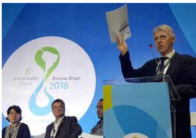
Член Правления Всемирного водного совета и председатель Тематической комиссии 8-го Всемирного водного форума Торкин Йонч-Клаузен открывает сессию высокого уровня «Возобновление ИУВР в Повестке дня до 2030 г.», 20 марта

На 8-м Форуме, в частности во время сессии высокого уровня «Возобновление ИУВР в Повестке дня до 2030 г.» обсуждались пути, с помощью которых интегрированное управление водными ресурсами (ИУВР) может привести к решению проблем управления водой на практике. Третья сессия высокого уровня из серии мероприятий, организованных в течение года, вновь повторила, что для Повестки дня до 2030 г. требуется ИУВР на качественно новом уровне. ИУВР должно быть адаптивным, причем оно также должно отвечать требованиям и других секторов, при этом работая с учетом ограничений политических реалий. Ключевые послания были включены в проблемный документ, изданный Всемирным водным советом под заголовком «Возобновление ИУВР в Повестке дня до 2030 г.».