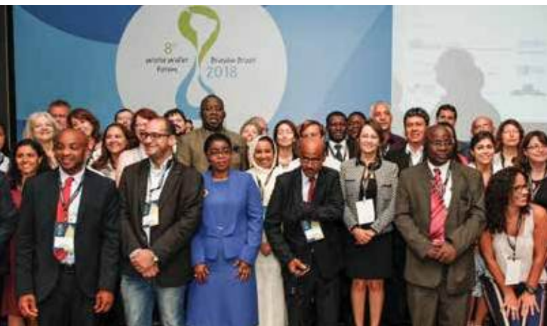
Участники на церемонии закрытия Международной конференции местных и региональных органов власти, 21 марта

После двухлетнего подготовительного процесса, поддержанного рядом международных партнеров, в т. ч. программой ООН-Хабитат в лице Глобального альянса партнерств предприятий водоснабжения, объединением «Местные органы власти за устойчивость», Секретариатом по федеральным вопросам при Президенте Федеративной Республики Бразилия, организацией «Объединенные города и местные власти» и Национальной конфедерацией муниципалитетов, более 300 участников собралось на Конференцию местных и региональных органов власти во время 8-го Форума. С целью демонстрации и усиления роли местных и региональных властей (МРВ) в достижении устойчивого будущего, участники приняли Призыв к действиям местных и региональных органов власти по водоснабжению и санитарии, в котором подчеркивается важная роль МРВ в управлении водой на местах и обеспечении решений по водоснабжению и санитарии местных общин.