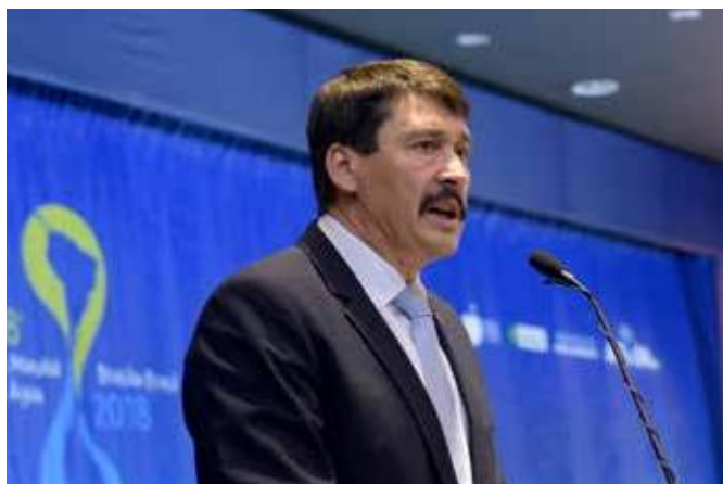
Выступление Президента Венгрии Яноша Адера на сессии Группы высокого уровня по финансированию водохозяйственной инфраструктуры

Для противостояния вызовам важно, чтобы ключевые решения шли от самого верхнего уровня политической иерархии вместе с национальным обязательством работать с различными заинтересованными сторонами для получения дополнительного финансирования. На Форуме это стало возможным благодаря участию Президента Республики Венгрия Яноша Адера на сессии Группы высокого уровня по финансированию водохозяйственной инфраструктуры (круглый стол по финансированию водохозяйственных проектов). Кроме того, еще большее влияние на вопросы финансирования оказали результаты сессии Группы высокого уровня по воде, на которой присутствовало 11 действующих глав государств. Другой член этой группы, присутствовавший на сессии от Голландии, Специальный посланник по водным вопросам Хенк Овинк подчеркнул важность определения ценности водных ресурсов. Группа высокого уровня по воде представила свои выводы в итоговом документе под названием «Важна каждая капля воды» как раз перед 8-м Всемирным водным форумом, в котором особое место отводится определению ценности воды, обеспечению финансовых средств и установке приоритетов для расширения финансирования в интересах воды и устойчивого роста.