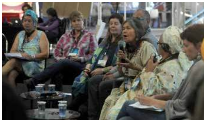
Женщины принимают участие в обсуждении во время круглого стола коренных общин как хранителей воды, 22 марта

Общественный форум также представил «Документ Общественного форума по 10 принципам», содержащий не только опыт, но и новые факты и идеи, явившиеся результатом участия в этом Гражданском процессе. В данном документе основное внимание уделяется идеям вокруг совместного использования, целостности экосистем, культуры использования воды и расширения участия общественности в принятии решений.